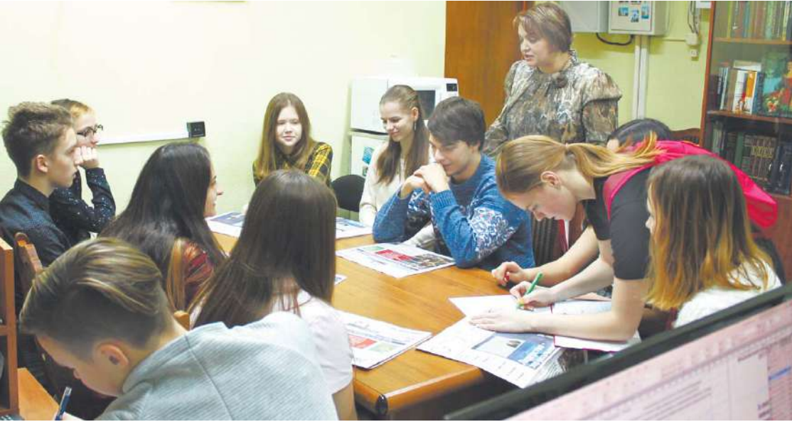
Юноши и девушки с удовольствием включились в разговор о газете

Ну, а первое занятие прошло великолепно! Юноши и девушки с удовольствием включились