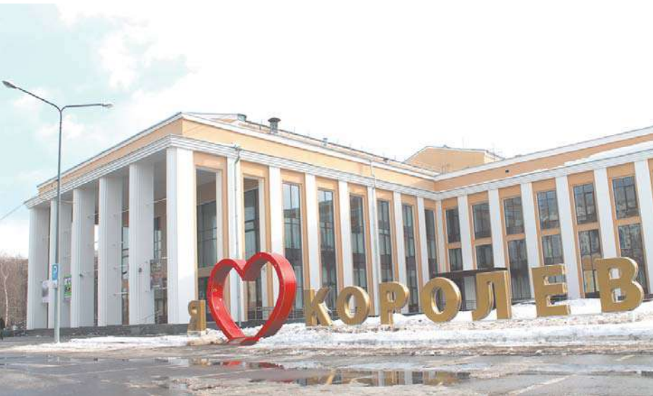
ЦДК им. М.И. Калинина – центр культурной жизни Королёва

Активисты местного отделения «Единой России» и представители комитета по культуре обсудили деятельность учреждений культуры наукограда. В работе круглого стола приняли участие члены