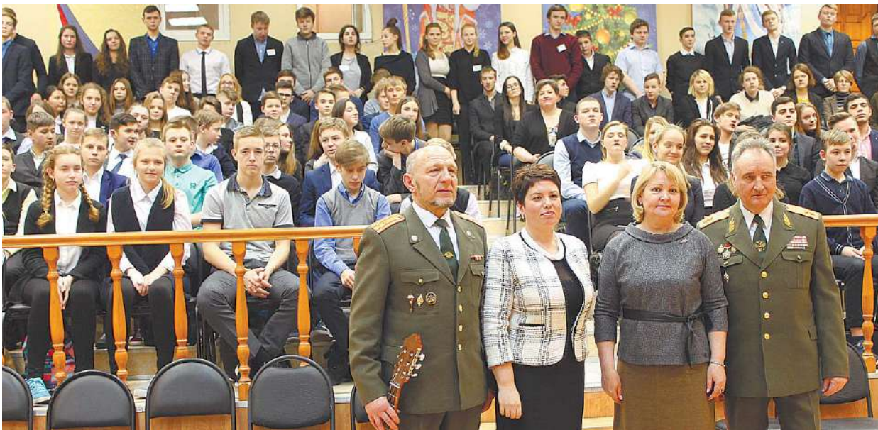
Встреча с ветеранами боевых действий стала в гимназии № 18 доброй традицией

По материалам пресс-службы местного отделения партии «Единая Россия»