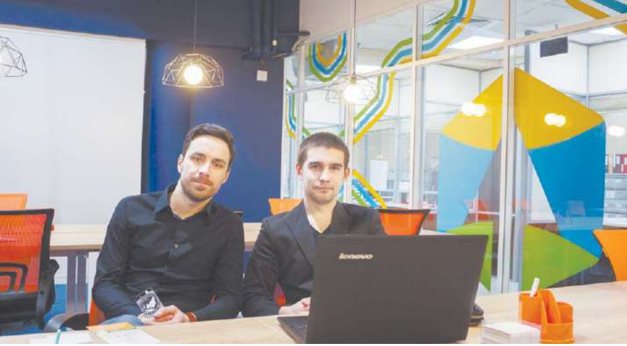
Коворкинг-центр: просторно и уютно

Коворкинг-центр «Старт» находится в ТЦ «Гелиос» на пр-те Космонавтов, д. 20А на том же этаже, что и Многофункциональный центр. Его помещение площадью 316 кв. м рассчитано на аренду рабочих мест для 46 человек и представляет собой