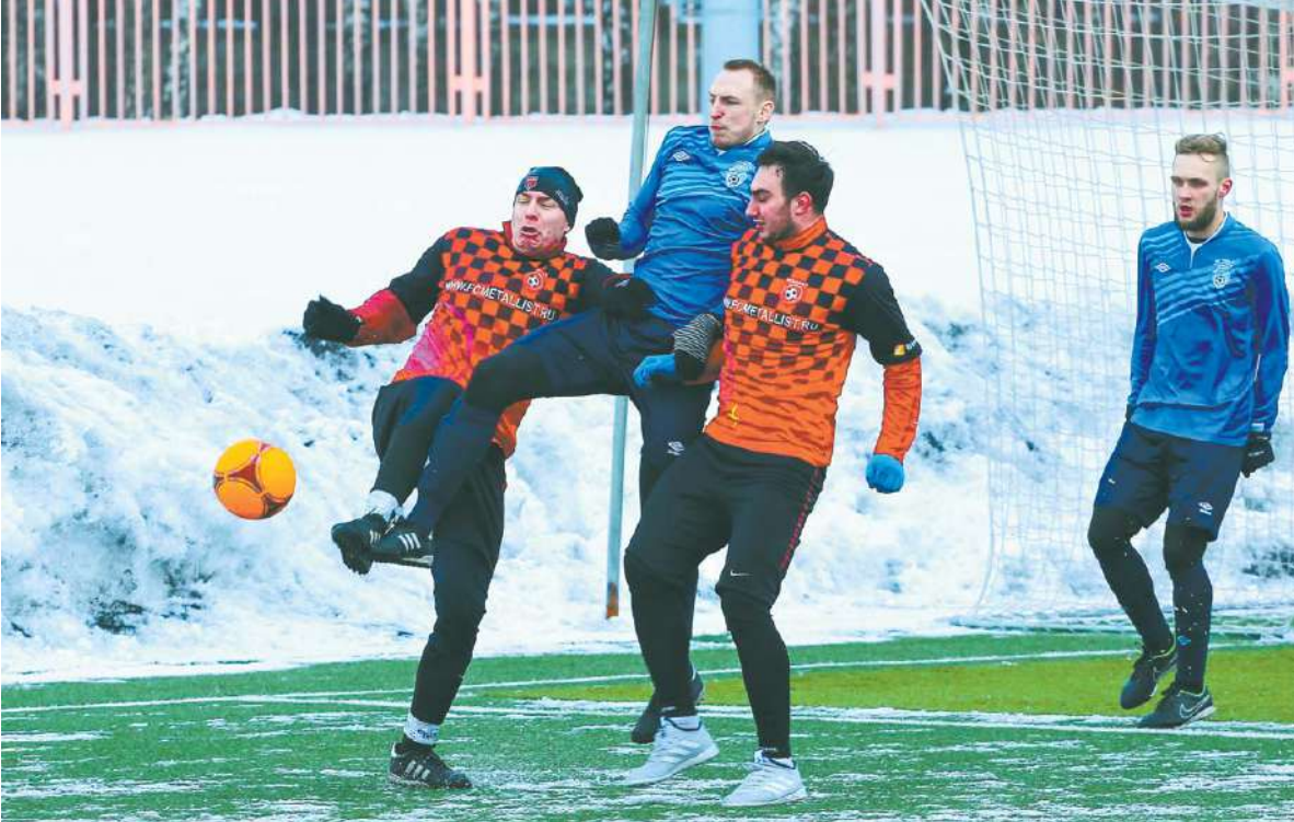
90 минут напряжённой борьбы

Во втором тайме рисунок игры не изменился. Больше атаковала «Чайка», но «Металлист» выглядел острее. Красно-чёрные здорово контратаковали, пользуясь свободными зонами, которые оставлял соперник, и вскоре забили третий мяч, правда,