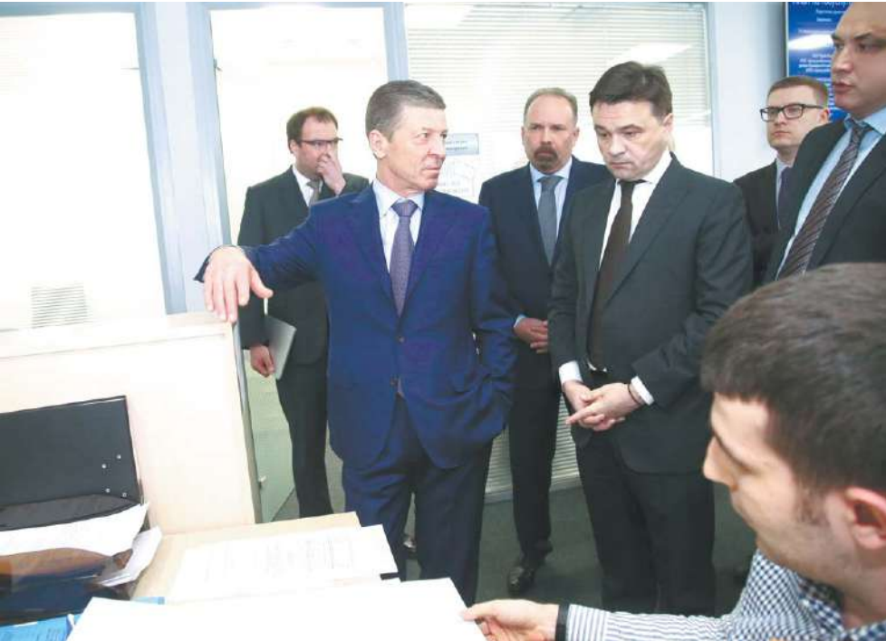
Андрей Воробьёв на открытии центра содействия строительству

Во время рабочего визита было отмечено, что в течение года правительство Московской области планирует реализовать 80 приоритетных проектов. При этом особое внимание уделят вопросам обеспечения защиты участников долевого жилищного строительства, поясняется в пресс-релизе пресс-службы губернатора. – С 1 марта мы включаемся в систему защиты людей при заключении договоров долевого участия. Эта система позволит видеть каждый строящийся дом. Каждая строительная компания, соответственно, по определённому стандарту будет заполнять