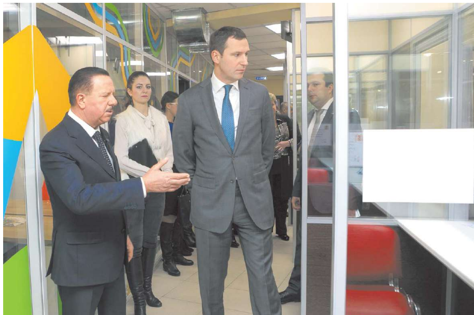
Задача Подмосковья – удержать малый и средний бизнес на своей территории

ОТКРЫТИЕ ПЕРВОГО В КОРОЛЁВЕ КОВОРКИНГ-ЦЕНТРА «СТАРТ» СОСТОЯЛОСЬ 10 ФЕВРАЛЯ. ЕГО ОСНОВНАЯ ЗАДАЧА – ОРГАНИЗАЦИЯ РАБОЧЕГО ПРОСТРАНСТВА ДЛЯ ВЗАИМОДЕЙСТВИЯ ПРЕДПРИНИМАТЕЛЕЙ. ПРОЕКТ РЕАЛИЗОВАН ЗА СЧЁТ ОБЛАСТНЫХ, МУНИЦИПАЛЬНЫХ И ЧАСТНЫХ СРЕДСТВ В РАМКАХ ПОДПРОГРАММЫ «РАЗВИТИЕ МАЛОГО И СРЕДНЕГО ПРЕДПРИНИМАТЕЛЬСТВА».