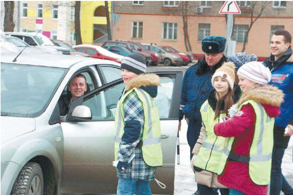
Школьники напомнили водителям о безопасности на дорогах

Цель акции – напомнить водителям и пешеходам о необходимости соблюдать правила дорожного движения. В преддверии Дня влюблённых сотрудники ГИБДД останавливали водителей, после чего активисты МГЕР рассказывали им об акции и вручали памятные листовки, дизайн которых разработали сами молодогвардейцы. Школьники дарили водителям письма с праздничными пожеланиями и призывами помнить о правилах, тем самым сохраняя жизнь и здоровье не только самих водителей, но также пассажиров и пешеходов. Подобные совместные акции королёвского штаба МГЕР с ГИБДД проходят уже третий год. Напомним, недавно в рамках этого сотрудничества среди студентов провели тест на знание правил дорожного движения. «Пропаганда безопасности дорожного движения является одной из приоритетных задач нашего отделения «Молодой Гвардии» г.о. Королёв. Этой акцией мы