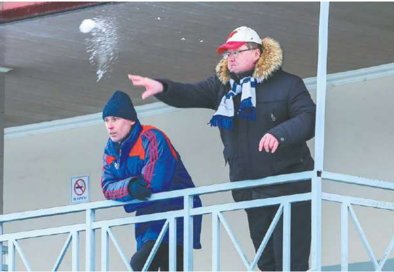
Снежок – оружие фаната